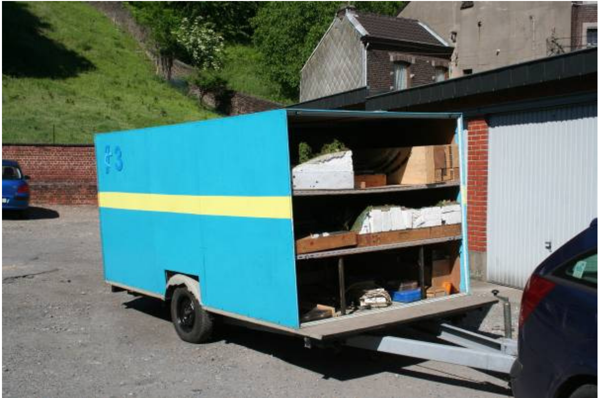
La remorque que Jean-Claude a aménagée pour y transporter le réseau.