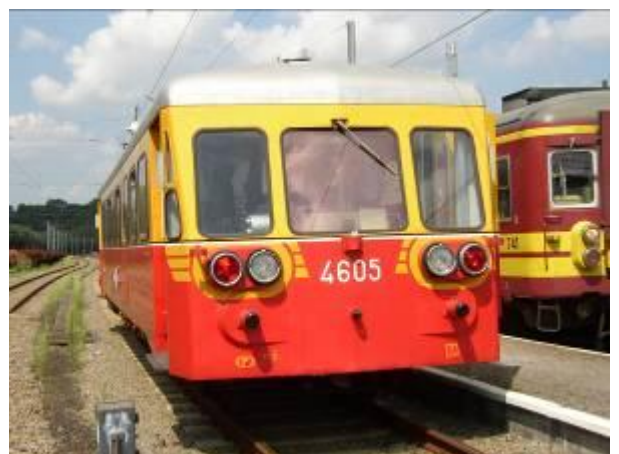
LE SECOND AUTORAIL EX-SNCB 4605 APPARTENANT AU PFT ASBL ET MIS EN SERVICE SUR LA LIGNE 128 LORS DE LA BROCANTE DE SPONTIN. GARE DE CINEY : LE 1 ER AOÛT 2004.

Après la seconde guerre mondiale, les trains de voyageurs étaient assurés par des autorails (type 551 et 553) entretenus par la remise de Ciney. Quant aux convois de marchandises, ils