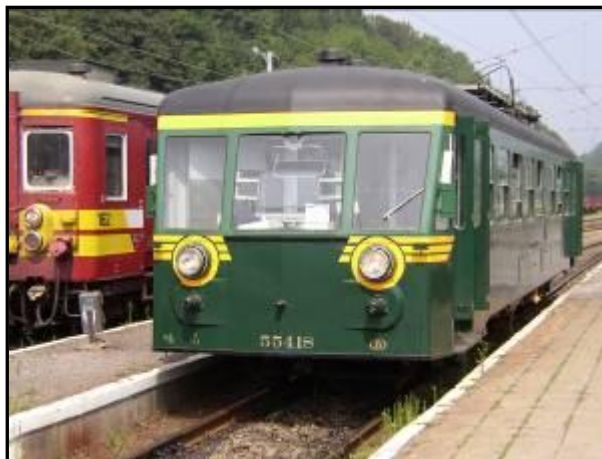
AUTORAIL EX-SNCB 554-18 EN GARE DE CINEY LE 01 AOÛT 2004

Il y a un peu plus d'un siècle était mise en service la ligne 128 entre Ciney et Yvoir. Considérée comme l'une des plus belles sections de chemin de fer de Belgique de par son inscription dans la vallée du Bocq et la présence de nombreux ouvrages d'art (viaducs, tunnels, ponts), cette ligne fait actuellement l'objet d'une étude de remise en service par l'asbl Patrimoine Ferroviaire Touristique.