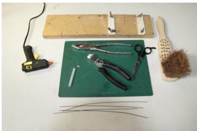
Planche de travail.

Après avoir préparé le matériel, il est temps de me m'hêtrer au bouleau, ce qui ne manque pas de charme.