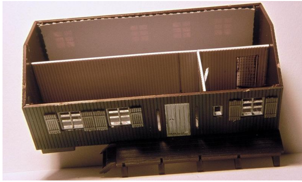
Première étape : la pose des cloisons en plaques d'imitation planches d'Evergreen. Remarques les tracés au stylo feutre qui seront masqués par la peinture.