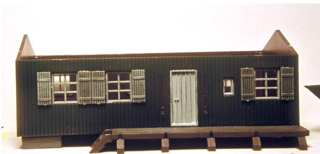
Le baraquement après assemblage des murs, portes, fenêtres et volets sur le socle de base. Nous allons aborder l'aménagement intérieur.

allemande en crépi + bois, un marchand de charbon US, un baraquement en bois de chez Faller, une douane Pola, un bâtiment de PN de MKD, et j'en passe... D'un coup, la lumière se fit dans mon esprit (une ampoule, à la Cubitus... « Pôvre Sénéchal » ;-))) Je me décidai à transformer certains de ces bâtiments pour figurer un ensemble de maisons typiquement belges. Le premier traité fut le baraquement Faller... Je peignis les murs en terre d'ombre brûlée (148/941