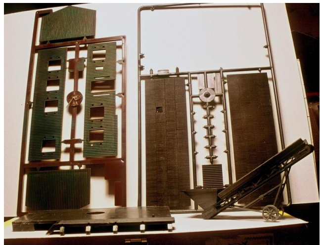
L'ensemble des pièces du kit de baraquement en bois de Faller, avec une sauterelle à charbon tirée d'un kit de super détaillage de Model Power USA.

En fait, je me retrouvai du jour au lendemain avec une rue en courbe d'environ 1 mètre 50 à meubler... Après mûres réflexions, je me décidai à construire les bâtiments en scratch et en réalisai trois d'emblée : un café – friagerie, une ancienne poste et une maison d'habitation... Après avoir laissé dormir le projet un certain temps (occupé que j'étais avec le projet « Montoire 1940 »), je retrouvai dans mes cartons un ensemble de kits de bâtiments plus hétéroclites que les autres... Une maison de PN