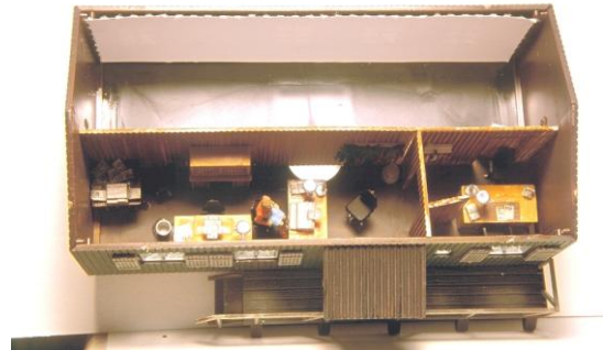
L'intérieur aménagé et peint... Une fois l'éclairage installé, il sera bien visible à travers les fenêtres.

détail » supplémentaire sous la forme d'un aménagement intérieur... Je réalisai les murs avec une plaque de plasticarte imitation bois de chez Evergreen (V-Grove) et peignis l'ensemble en couleur claire (mélange de 136/818 red leather et de 148/941 Burnt Umber). Ensuite, je peignis le sol en gris béton et positionnai les divers bureaux tirés d'un kit de détaillage de Preiser (ref. 17184) et deux figurines : une secrétaire passablement effrayée et un patron furax en train de l'enguirlander.... Le tout éclairé par une ampoule Pola fixée à un mât en balsa lui-même fixé au « tape » sur l'arrière de la cloison de l'aménagement intérieur... Le tout peut être ôté par le dessous du bâtiment via un trou, permettant le remplacement de l'ampoule. Le toit est alors collé en place et peint en noir mat (Vallejo 169/950 Black) puis drybrushé au gris progressivement éclairci (Vallejo 166/994 Dark Grey et 002/919 Foundation White)