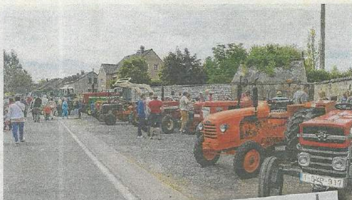
360 tracteurs ont pris part au Tracto-vie 2015

Ce dimanche, se tenait à Fronville la 1 re édition du, désormais célèbre, Tracto-vie, une manifestation qui rassemble tous les deux ans passionnés et défenseurs de la ruralité autour d'une cause commune, le soutien à la recherche médicale. En effet, l'intégralité des bénéfices récoltés tout au long de la journée sera reversée à deux associations, le service de radiothérapie du Centre hospitalier universitaire de Liège et la Recherche en cardiologie pédiatrique. Lors de la précédente édition, le comité Tracto-vie de Fronville était ainsi parvenu à récolter 60 000 €. Il espérait évidemment faire aussi bien cette année.